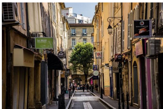
Odalys Atrium, Aix-en-Provence

Fly Norwegian, Oslo – Trondheim, 15:40-16:35 (dere kan bruke «Domestic Transfer» og slipper å ta ut bagasje på Gardermoen for videre reise til Trondheim).