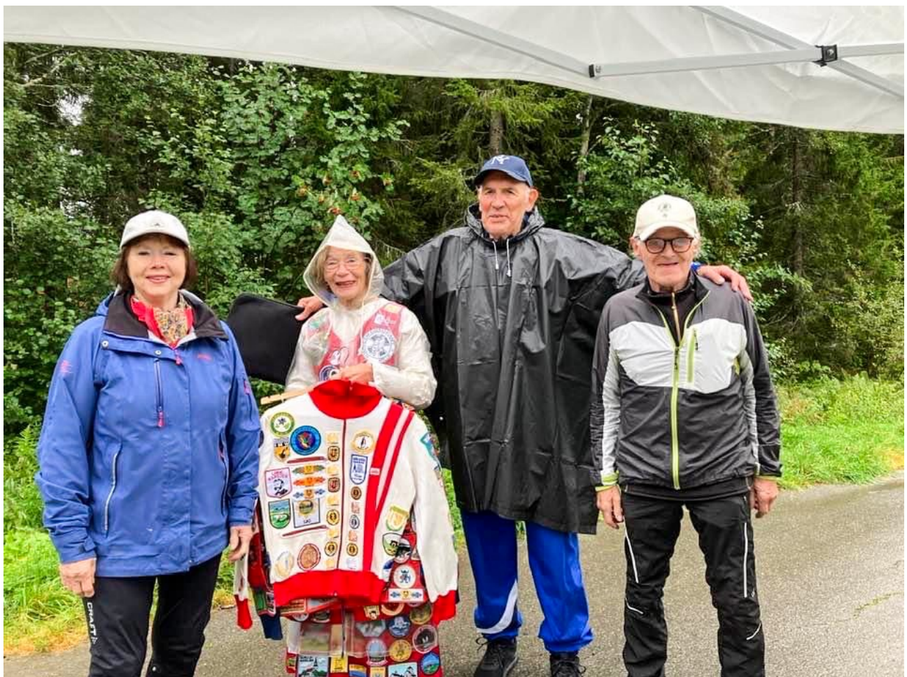
Vell blåst etter 10-timers innsats i frivillighetens tjeneste søndag klokken 21:30.