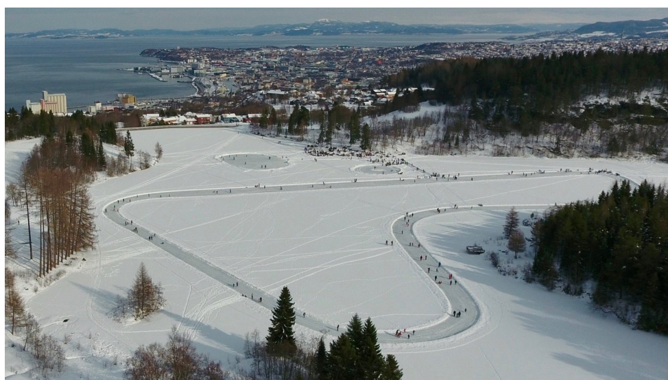
Vinteraktivitet på Theisendammen