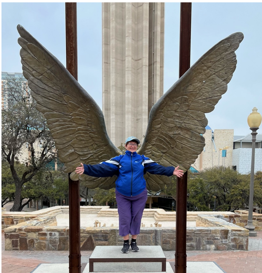
Da Brit trodde hun kunne fly med lånte vinger i Texas.